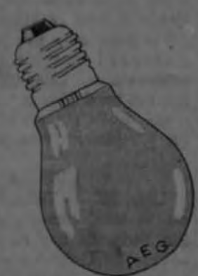
Bombillas de Fama mundial